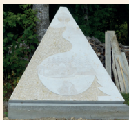
VIRIEU-LE-PETIT Yves Perey